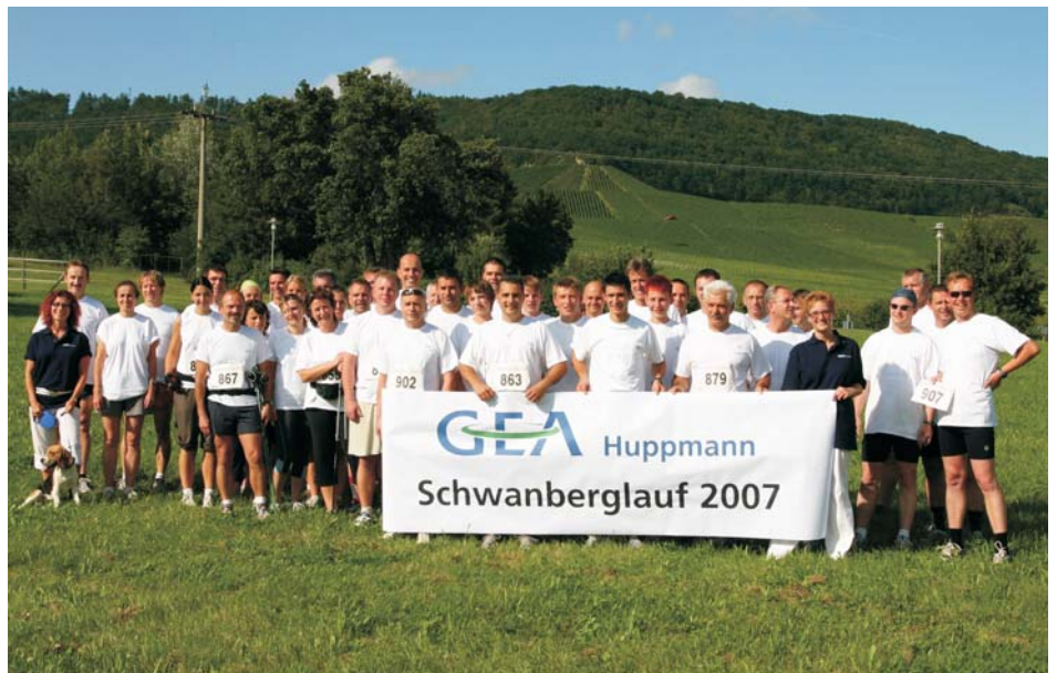
Gruppenfoto: Die Teilnehmer von Huppmann vor dem Schwanberg

Beim Zieleinlauf konnten die Huppmann-Fans alle 52 Läufer mit Jubel empfangen und anschließend gemeinsam am Casteller Weinfest einige gemütliche Stunden verbringen.