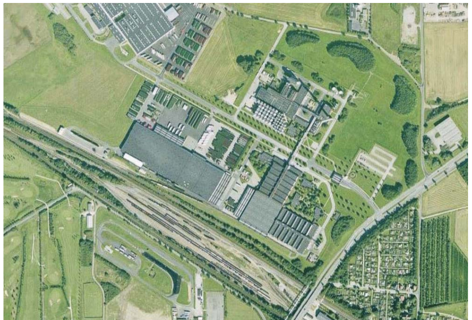
Bereits jetzt beeindruckend: der Carlsberg-Standort Fredericia vom Satelliten aus gesehen.

Die Erweiterung und Anpassung der existierenden Sudhausanlagen wie auch die Installation eines neuen Sudhauses wird Huppmann durchführen. Die Komplexität der Aufgabe erfordert erfahrene Ingenieure und individuelle Lösungen. Diese haben die dänischen Brauer bei Huppmann in Kitzingen gefunden.